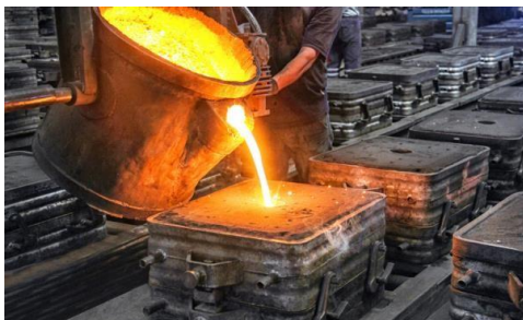
Figura. 1 Molde para fundición