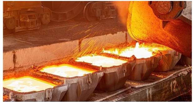
Figura 4 Características del material para ser fundido

Plomo y estaño: alta densidad; precisión dimensional extremadamente estrecha; se utiliza para formas especiales de resistencia a la corrosión.