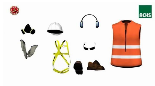
Figura 3. Equipo personal de protección