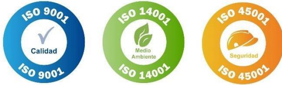
Figura 5 Normatividad ISO